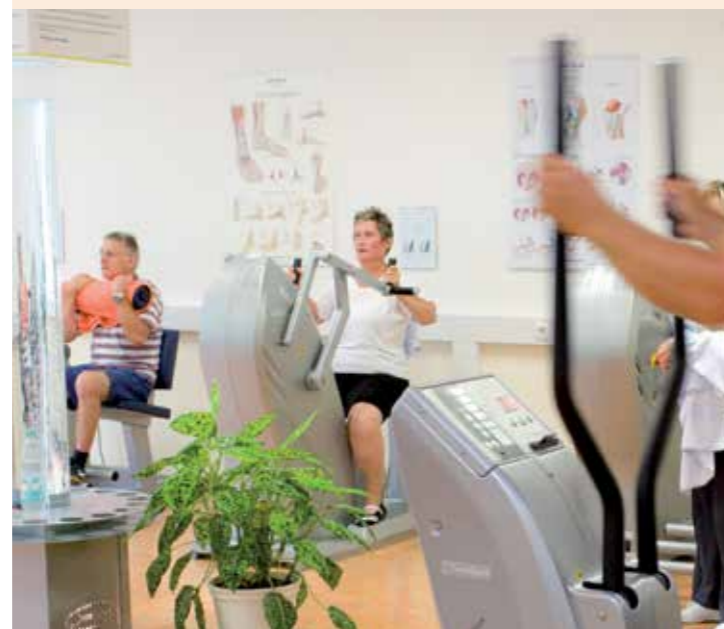
Elbtalklinik Bad Wilsnack

Die Elbtalklinik Bad Wilsnack stellt eine leistungsfähige, nach modernsten Gesichtspunkten gestaltete Rehabilitationseinrichtung dar, in der die Umsetzung neuester medizinischer Erkenntnisse in der rehabilitativen Medizin zugunsten der Patienten verwirklicht wird. Die Klinik liegt zusammen mit dem Kurmittelhaus im Stadtrandbereich von Bad Wilsnack in eine Parkstruktur von über 200.000 qm eingebettet.