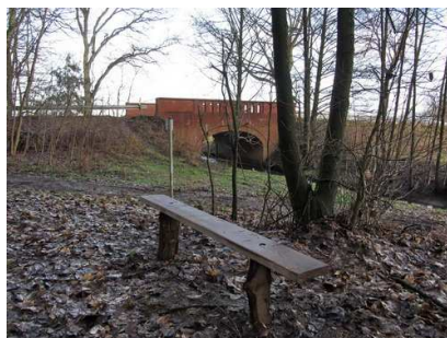
Straßenbrücke in Haaren